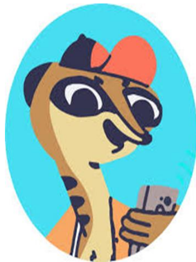
Mongu for teen