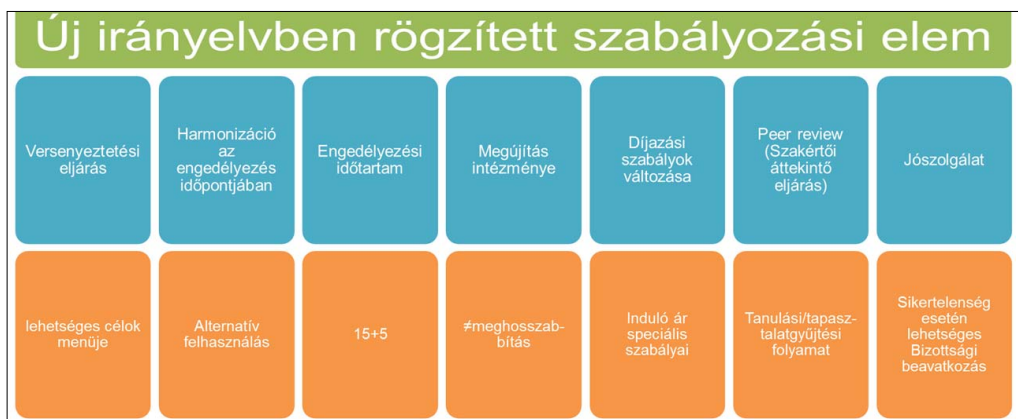
2. ábra A Kódexben található, spektrumhasználattal összefüggő, lényegesebb új szabályok áttekintése

határozat rögzített engedélyezési eljárások lefolytatására vonatkozó határidőket. E mellett a 700 MHz-es frekvenciasáv vonatkozásában született parlamenti és tanácsi határozat 12 , mely a jelenleg műsorszórásra használt teljes 470–790 MHz sáv további felhasználására, valamint a 700 MHz-es frekvenciasáv műsorszórástól eltérő elektronikus hírközlési szolgáltatási célú felhasználására tartalmazza a tagállami kötelezettségeket, határidőkkel.