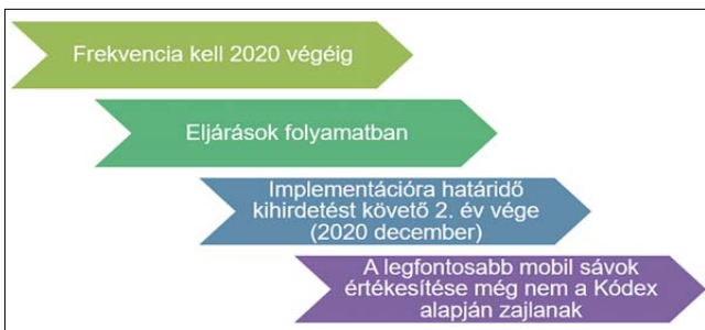
1. ábra Az 5G-hez szükséges frekvenciák elosztásának és a Kódex implementálásának időbeli áttekintése

A tagállami frekvenciaelosztási eljárások időbeli összehangolását szolgálja a Kódex 53. cikke. A jelenleg hatályos uniós jogforrások alapján egyrészt a Rádióspektrum-határozat alapján alkotott harmonizációs szabályokat rögzítő döntések tartalmaztak kijelölési és rendelkezésre bocsajtási határidőket. Másrészt a többéves rádióspektrum-politikai program létrehozásáról szóló 243/2012/EU