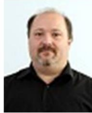
Szabó László Pro. M Zrt Biztonságos szélessávú adatátviteli szolgáltatás az EDR hálózatban