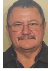
Bódi Antal OE BDI, KTI Az 5G hálózat és a közlekedés információbiztonsági kihívásai