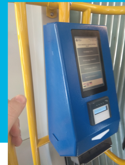
Number of tickets sold

● Single ticket ● 24-hour ticket ● 72-hour ticket